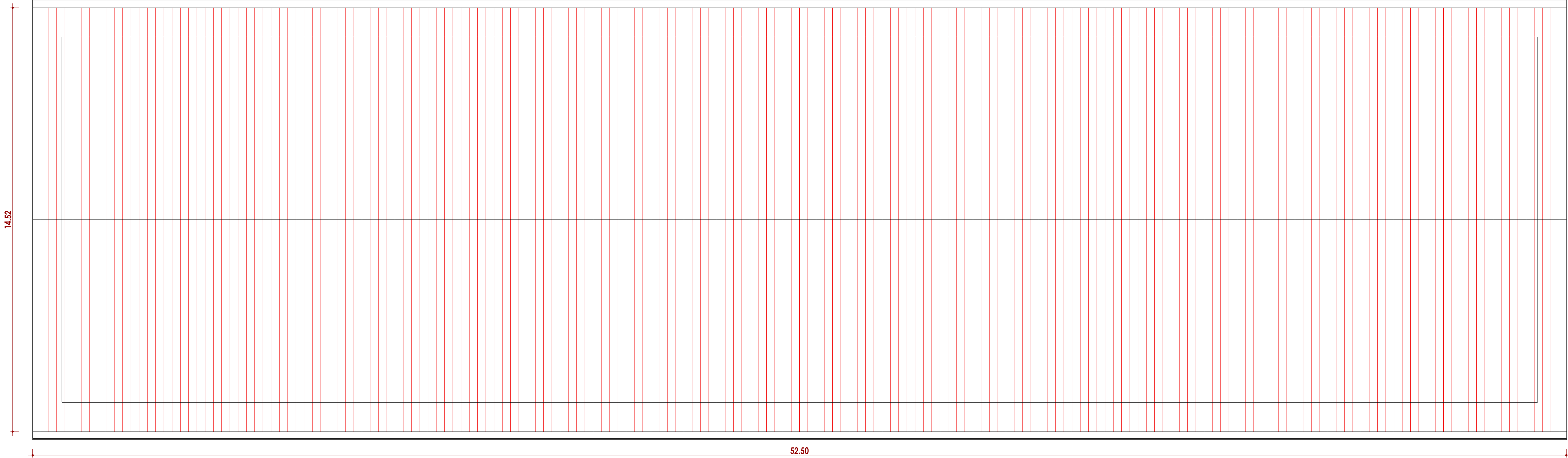
PLANTA DE COBERTURA TESTES SUÍNOS – CONSTRUIR ESCALA.: 1/75